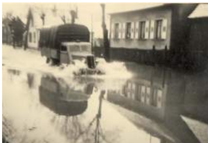
29 mars 1952