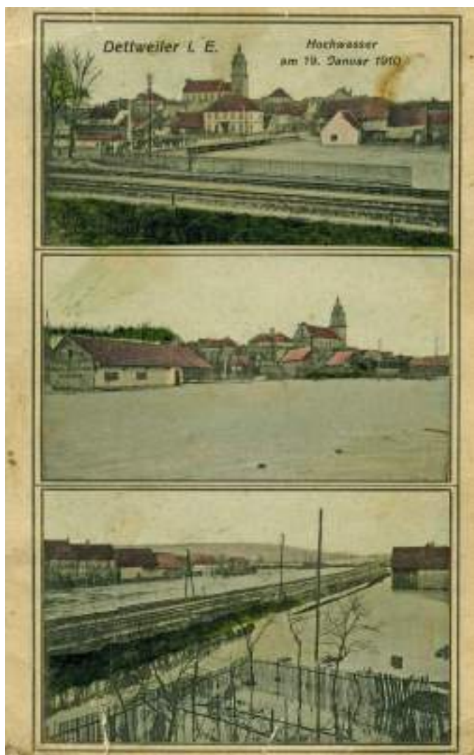
19 janvier 1910