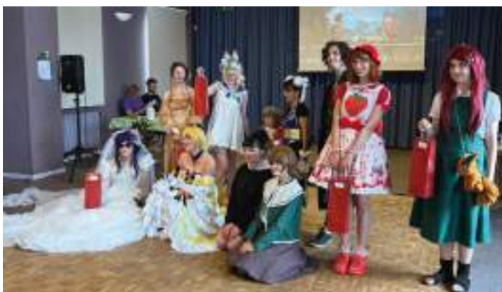
Concours de COSPLAY