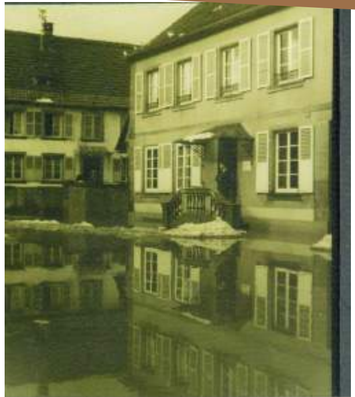
9.2.58 Hochwasser bei Dr. Brubach Str.