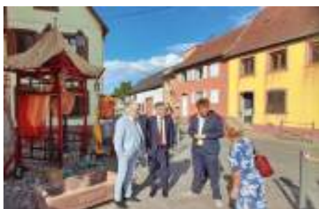
Visite du Consul Général du Japon