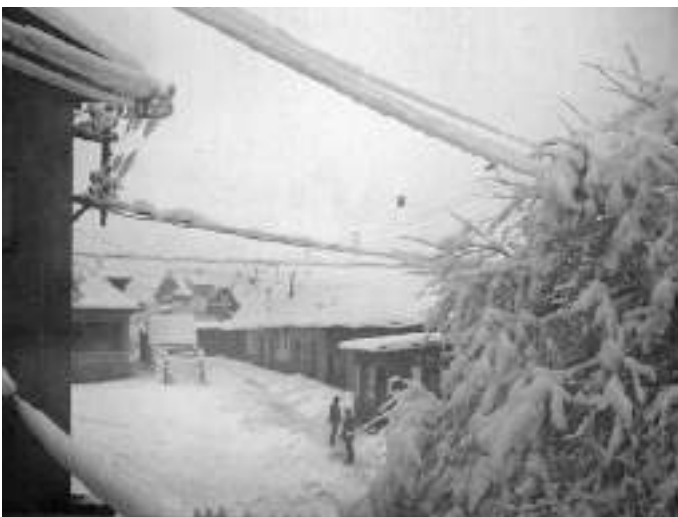
Fin Janvier 1958 Une épaisse couche de neige recouvre Dettwiller et les environs