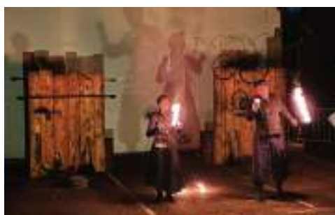
Spectacle de feu Acroballes