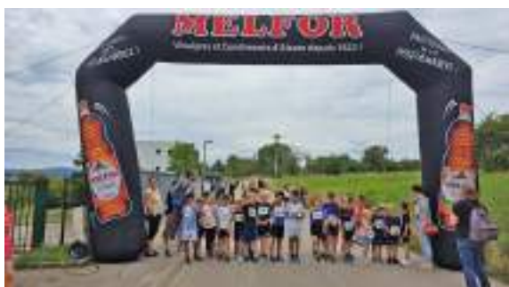
Foulées de Dettwiller