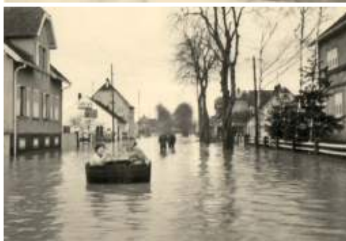
29 mars 1952